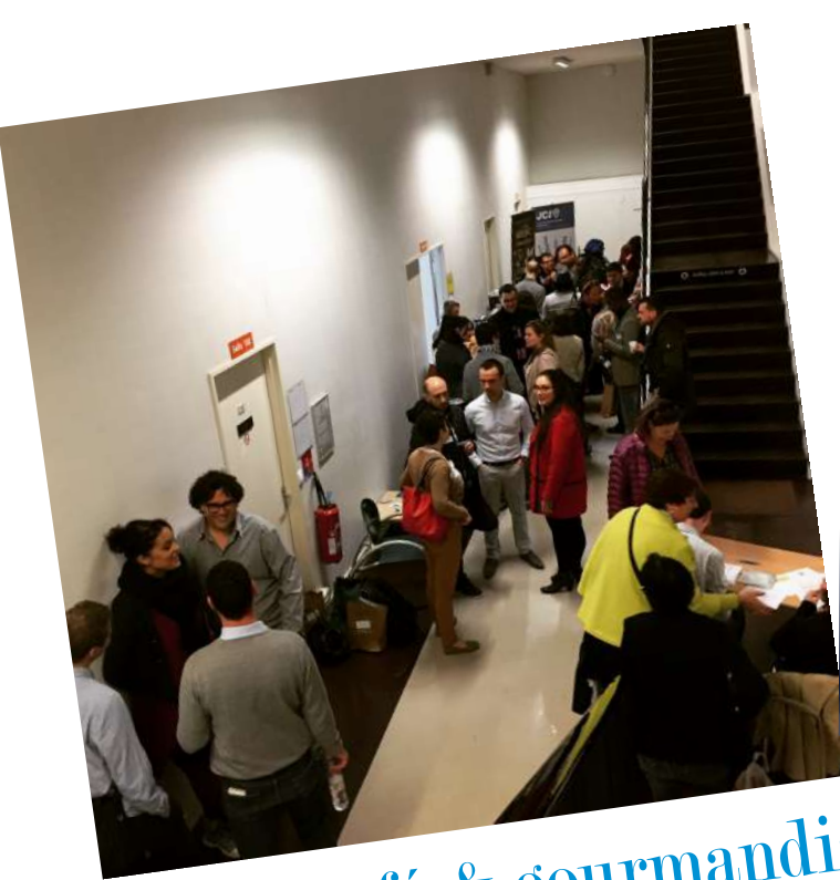
Accueil, café & gourmandises

Samedi 8 avril la JCE de Rochefort nous accueillait pour une JRF Fun !!!