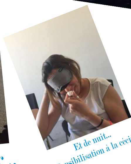
Et de nuit... Sensibilisation à la cécité