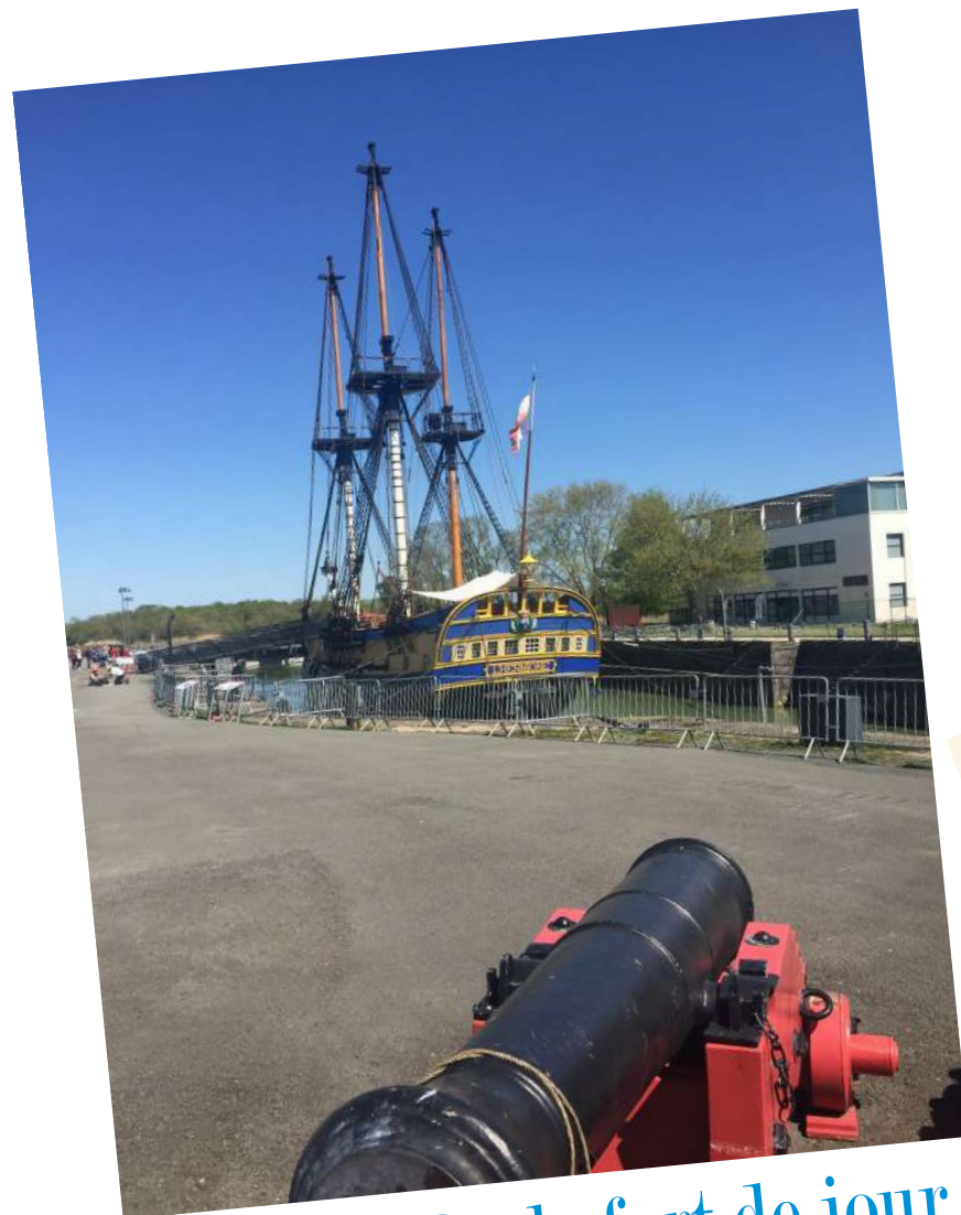
Visite de Rochefort de jour...