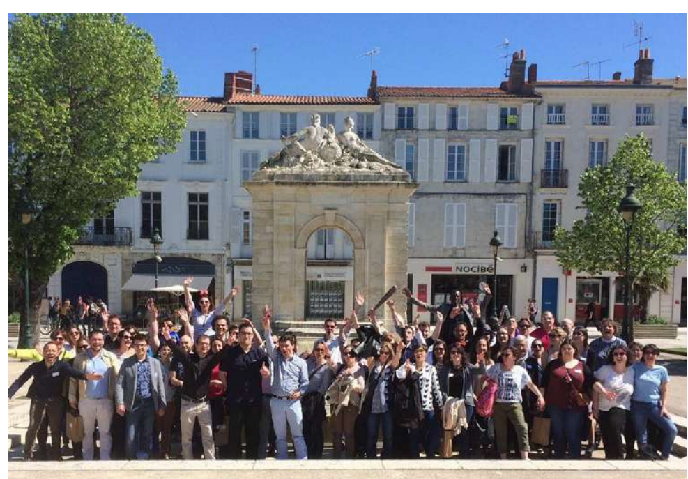
Merci Rochefort pour la journée !!!